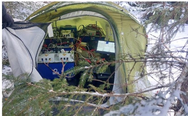
Fig. 1 : Matériel d'acquisition RMP lors de l'installation de l'expérience time-lapse en novembre 2024.

Contexte du projet : La résonance magnétique protonique (RMP) est une méthode géophysique directement sensible à la distribution de l'eau souterraine. Ces mesures peuvent être répétées dans le temps pour suivre les dynamiques de cette teneur en eau. Une campagne de suivi temporel RMP a été effectuée pendant l'hiver 2024-2025 sur le bassin versant du Strengbach, dans les Vosges ( OHGE ). L'objectif de ce suivi est d'analyser grâce à la RMP les effets des différents phénomènes météorologiques (événement pluvieux, fonte de neige) sur l'hydrosystème et de caractériser grâce à ces données les propriétés hydrodynamiques du milieu souterrain.