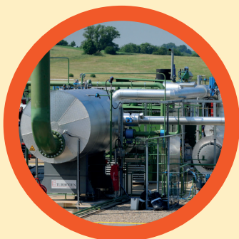
Centrale géothermique d'Hellisheidi, Islande.

L'énergie géothermique représente une alternative pour le futur. Plus on fore profondément dans la croûte terrestre, plus la température augmente... Cap sur l'Islande et l'Alsace, où l'on expérimente des techniques de pointe.